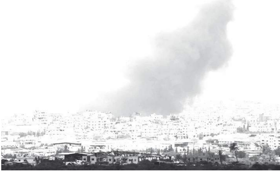
Des volutes de fumée se dégageant des bombardements sionistes sur la bande de Gaza depuis une position dans le Sud de l'entité sioniste, hier.

SYNTHÈSE — L'armée d'occupation a encore bombardé hier la bande de Gaza, au moment où le chef de l'ONU a exhorté à un cessez-le-feu «immédiat» dans le territoire palestinien assiégé et menacé de famine. En effet, Antonio Guterres, a appelé hier à un cessez-le-feu «immédiat» dans la bande de Gaza, au retour des otages et à une augmentation de l'aide au territoire palestinien assiégé. «Je réitère mon appel, l'appel du monde entier à un cessez-le-feu humanitaire immédiat, à la libération inconditionnelle de tous les otages et à une augmentation immédiate de l'aide humanitaire. Mais un cessez-le-feu ne sera qu'un début. Le chemin sera long pour se remettre de la dévastation et du traumatisme de cette guerre», a-t-il déclaré dans une allocution vidéo lors d'une conférence internationale de donateurs au Koweït.