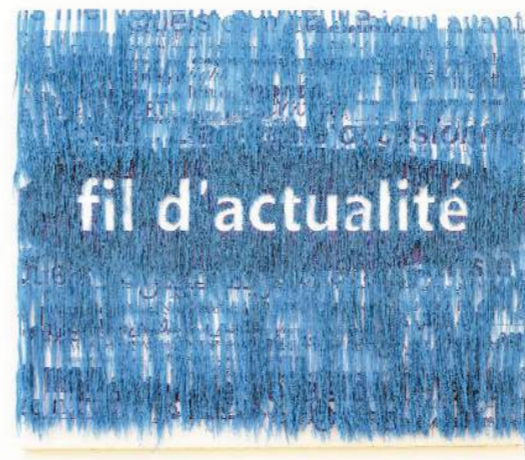
Emna Ghezaiel, « Fil d'actualité », technique mixte (fil sur toile imprimée). 90x110cm

A la demande de Aïcha Filali, vingt et un artistes confirmés ont arpenté le labyrinthe captivant de la mémoire, réveillant les souvenirs enfouis et les histoires oubliées, dans une exposition qui défie l'espace et le temps.