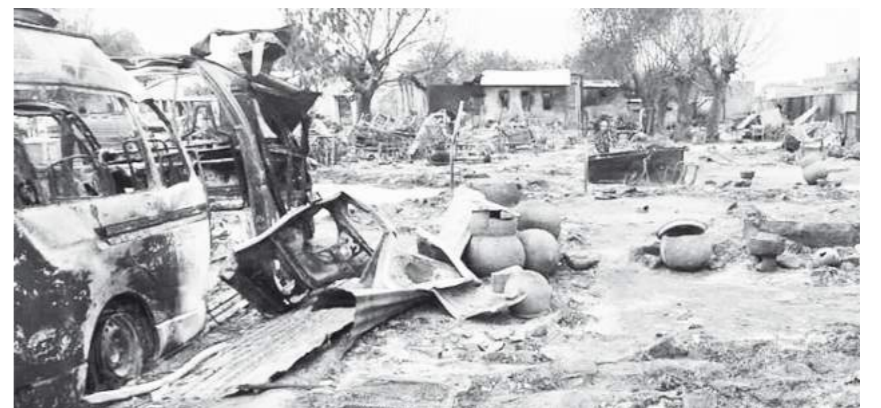
Destructions après des bombardements à el-Facher, capitale du Darfour-Nord, le 1er septembre 2023.

Le conflit a fait des dizaines de milliers de morts. A el-Geneina, capitale du Darfour-Ouest, 10.000 à 15.000 personnes ont été tuées, selon l'ONU. Les habitants d'el-Facher, capitale de l'Etat du Darfour-Nord, à environ 400 kilomètres à l'est d'el-Geneina, redoutent un scénario similaire. Leur ville avait jusqu'à présent été relativement épargnée grâce à une paix précaire négociée entre des groupes armés locaux et les FSR. Mais le mois dernier, les deux principaux groupes armés ont renoncé à leur neutralité pour combattre aux côtés de l'armée. En réponse, les