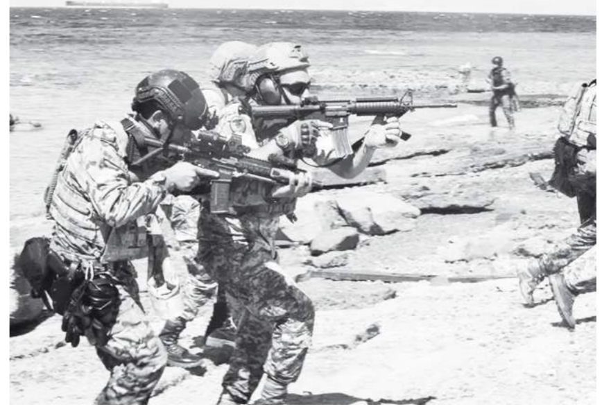
Une équipe jordanienne de lutte contre le terrorisme maritime et des commandos de la marine libanaise menant des opérations sur la plage d'Aqaba, en Jordanie, lors de l'exercice « Eager Lion », le 8 septembre 2022.

Les forces participantes s'entraîneront notamment à «faire face aux menaces des organisations terroristes» et «à la prolifération de drones (...) et de missiles de différentes portées», a-t-il ajouté. Le porte-parole n'a pas précisé le nombre de militaires participants, mais a précisé qu'il s'agit du «plus gros exercice» depuis la première édition d'«Eager Lion» en 2011. Parmi les pays qui prendront part aux manœuvres figurent également: la Pologne, la Norvège, la Roumanie,