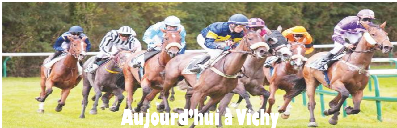
Aujourd'hui à Vichy