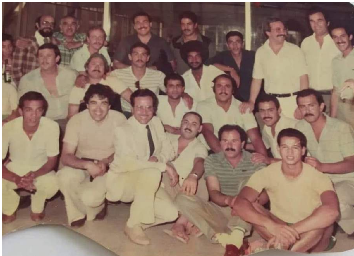
Avec El Menzah Sport.

entraîné pendant un court moment les juniors d'El Menzah.