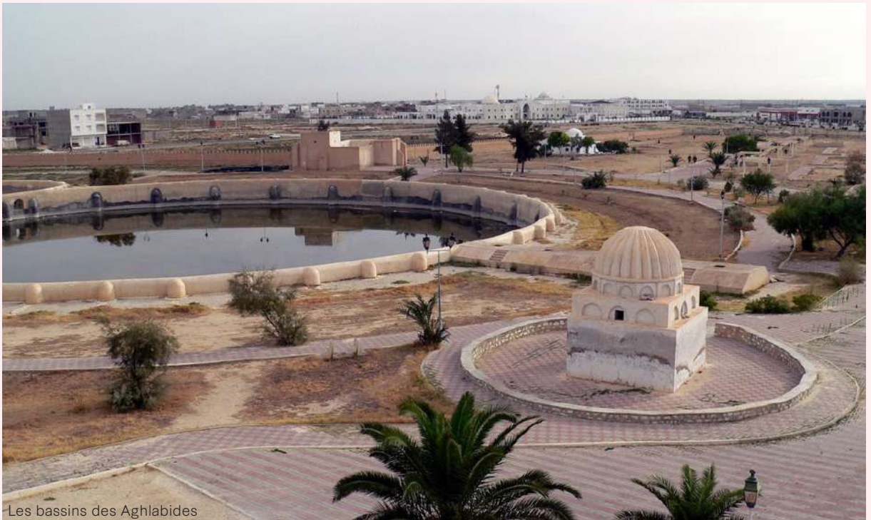
Les bassins des Aghlabides

K airouan occupe une place privilégiée dans le cœur des Tunisiens après La Mecque et Médine. Héritière du premier campement en Ifriqiya des conquérants musulmans, elle fut capitale royale puis ville sainte. En outre, Okba Ibn Nafaâ, le conquérant du Maghreb, qui fonda Kairouan en 670, a été tellement inspiré par les prédispositions stratégiques de cette ville sainte qu'il pria Dieu de la bénir et de la préserver jusqu'à la fin des temps.