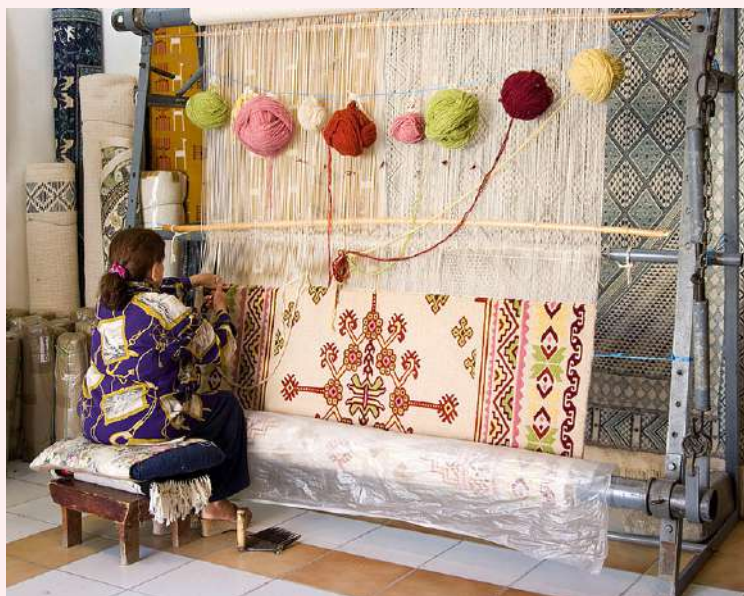
Le tapis de Kairouan