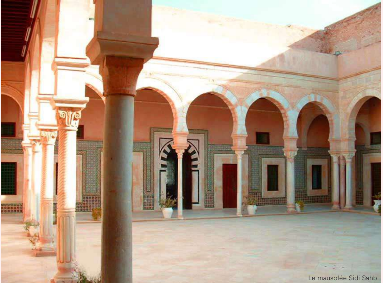
Le mausolée Sidi Sahbi

elle est faite en bois peint et sculpté, et a fait l'objet de plusieurs réfections à travers les âges.